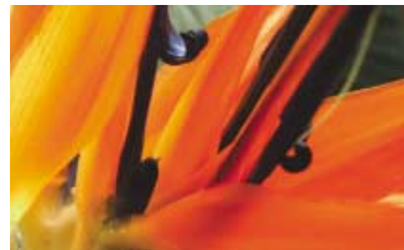
Ein Detail der farbenfrohen Blüte der Paradiesvogelblume

fächerförmig auf. Sie können 2 bis 8 Meter hoch wachsen. Floristen schneiden meine Blüten gerne ab, da sie sich noch lange in der Vase frisch halten. Ich besitze eine hohe Verdunstungsleistung und verbrauche im Sommer viel Wasser. Meine fleischigen Wurzeln mögen Staunässe jedoch gar nicht. Wenn es dazu kommt, bilde ich keine Blüte aus. Sonnige Standorte mag ich gerne. In der dunklen Jahreszeit fühle ich mich bei niedrigen Temperaturen wohler, 10°C reichen aus. Dementsprechend gering ist dann auch mein Wasserbedarf. Bei optima-