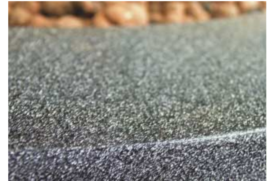
Das Chamäleon bietet eine vielfältige Farbgestaltung – hier Sonderlackierung „Nebel“

Mit Rot wird Leidenschaft und Hitze assoziiert. Es ist eine sehr dynamische Farbe, die der Liebe und des Hasses. Etwas kann ein rotes Tuch für jemanden sein, der Begriff der roten Zahlen ist allgemein bekannt, der rote Faden sollte nicht verloren werden und ein nahegehendes Ereignis ist manchmal zum rot werden.